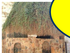
*Nachfahre des brennenden Dornbusch,

Preis pro Person mind. Teilnehmerzahl 2 133 €